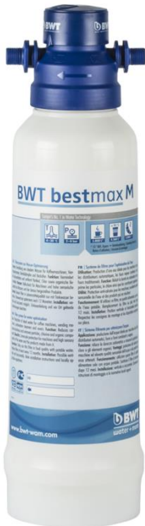
Breite ohne Anschlußschläuche